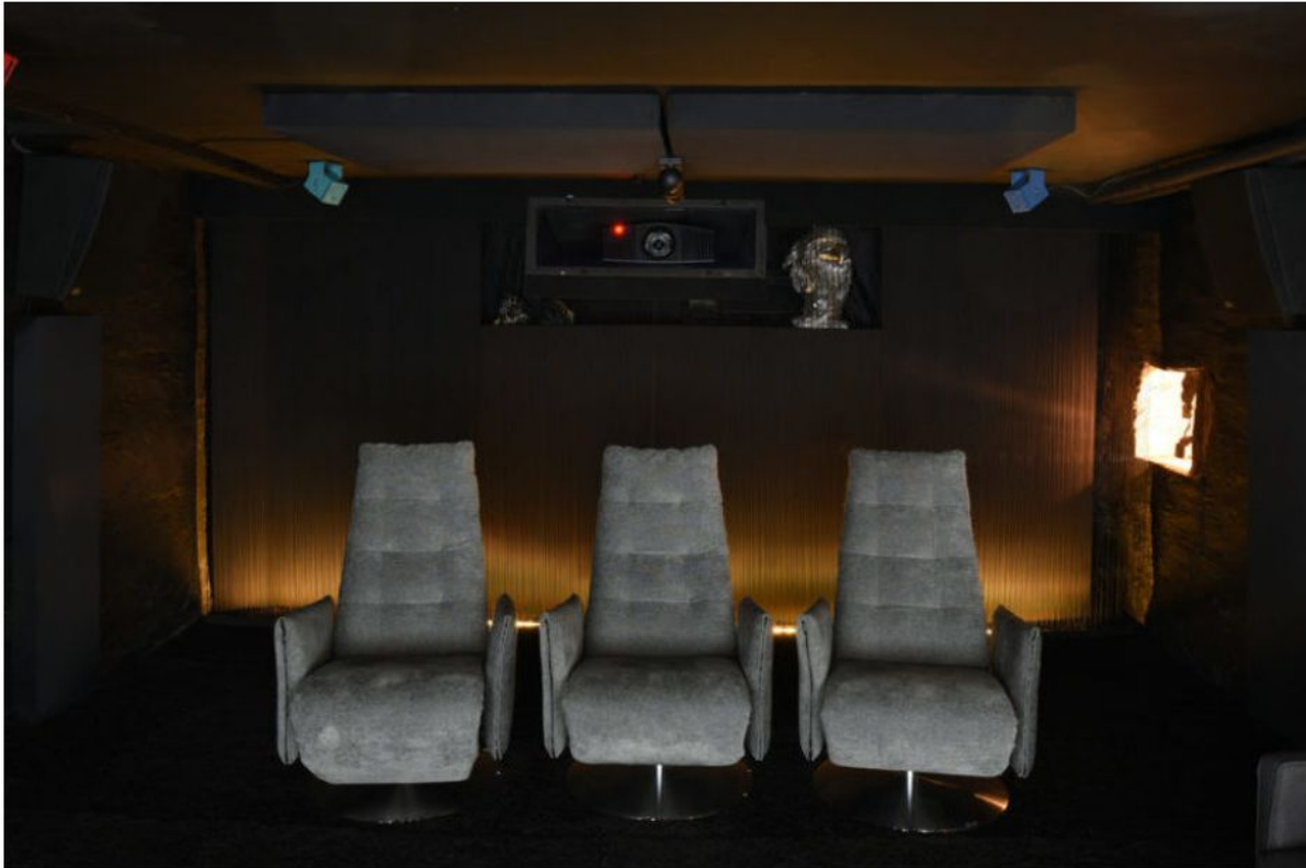
Audio Visions Heimkino-Showroom