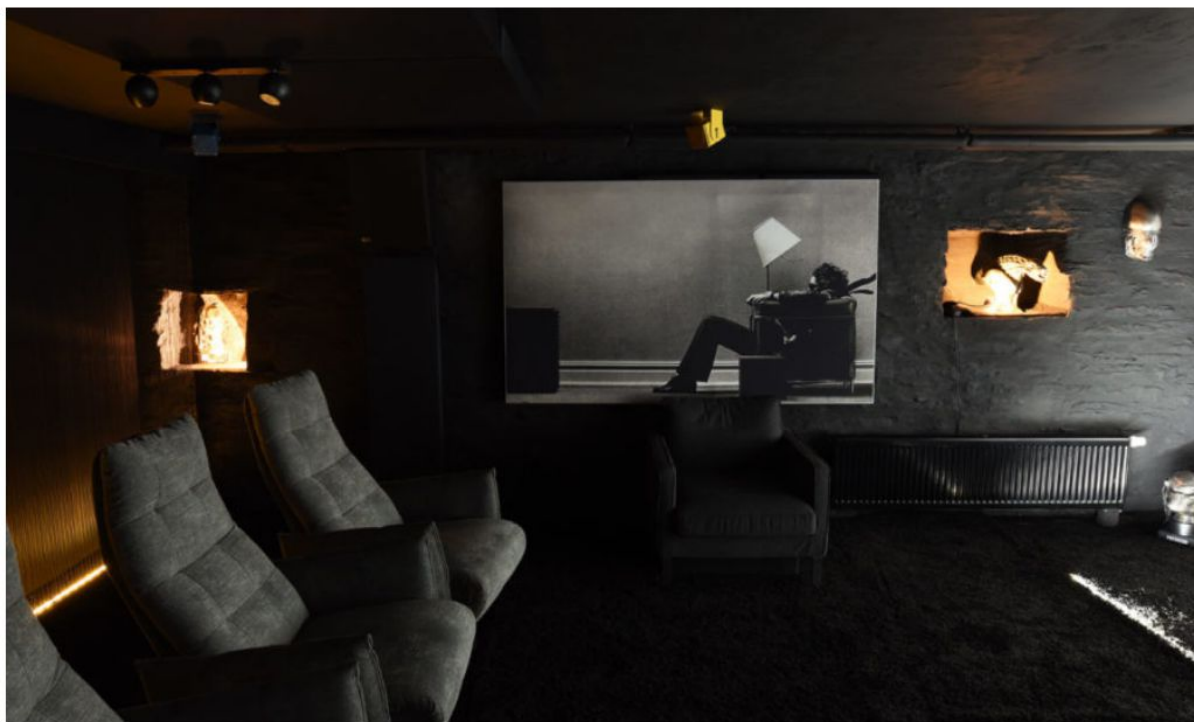
Audio Visions stattet Heimkino mit der Cinema Produktreihe von Meyer Sound aus.